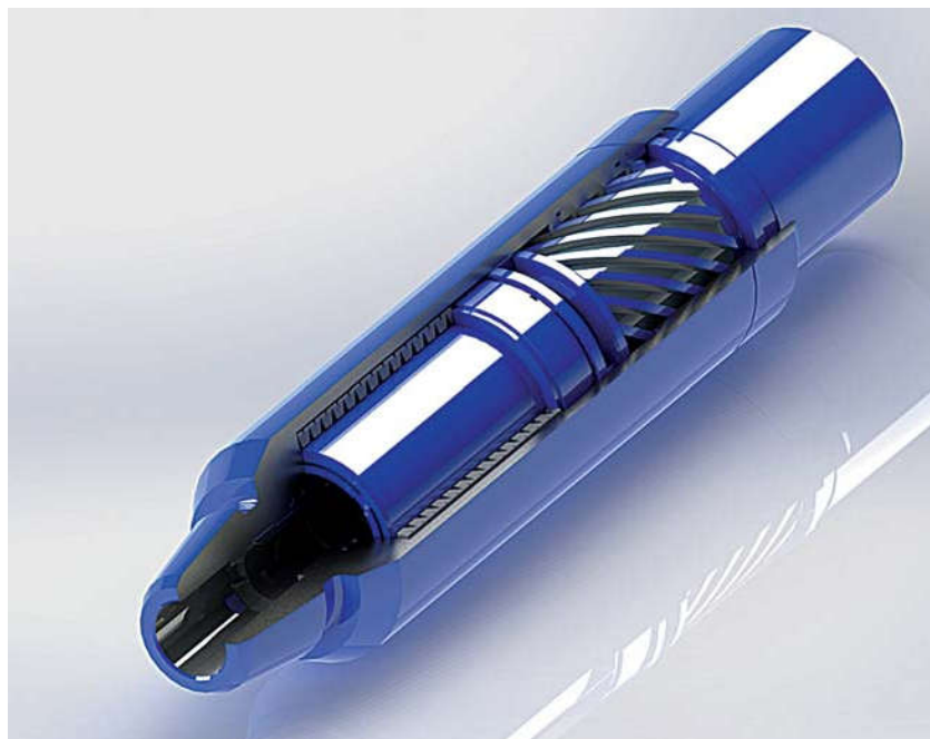
Рис. 2. Протектор